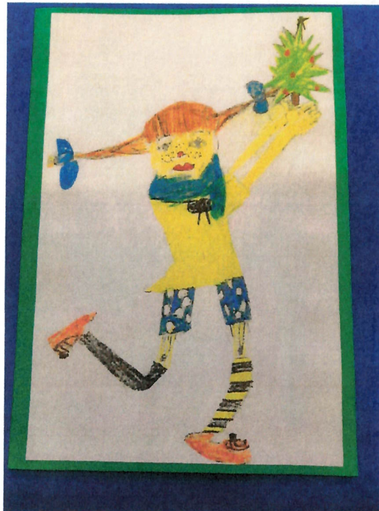
gemalt von Alesia und Nika Klasse 4a /2020

Wir werden im Gottesdienst im ganz kleinen Kreis, die Viertklässler verabschieden. Auch diese Kinder werden eine Lücke hier in der Schule hinterlassen. Sie haben sich besonders durch ihr vorbildliches Sozialverhalten und ihre guten Leistungen hervorgetan. Die Kinder sind gut vorbereitet auf ihr neues Kapitel!